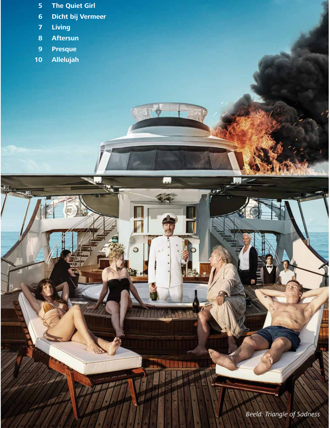
Beeld: Triangle of Sadness