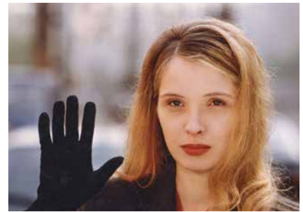
Beeld: Trois Couleurs: Blanc