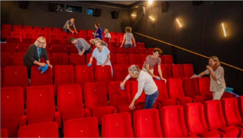
Vrijwilligers poetsen de vernieuwde rode zaal nog even extra goed voor de feestelijke heropening.

39 minuten geleden · leestijd 3 minuten · Kunst &amp; Cultuur · Voorlezen