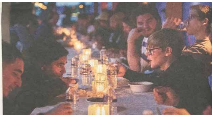
Iftar in Filmtheater Hilversum.