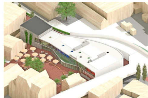
Zo moet het complex er na de uitbreiding uitzien.