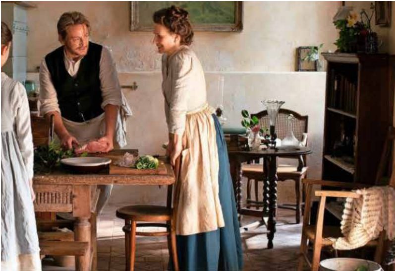
'Le pot-au-feu' met Juliette Binoche is de openingsfilm van het vijfdaagse Filmfestival in Hilversum.