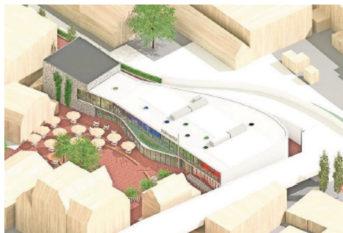
Toekomstbeeld met rechts de Hilvertshof-oprit.

„Wij willen en als gemeente geen situatie dat er oneerlijke concurrentie ontstaat met andere organisaties of bedrijven.”