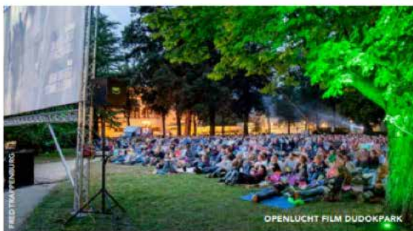
OPENLUCHT FILM DUDOKPARK

De Vorstin presenteert van 24 tot en met 27 augustus 2023 de allereerste editie van de concertserie Live in 't Bos. Dit unieke evenement biedt optredens van