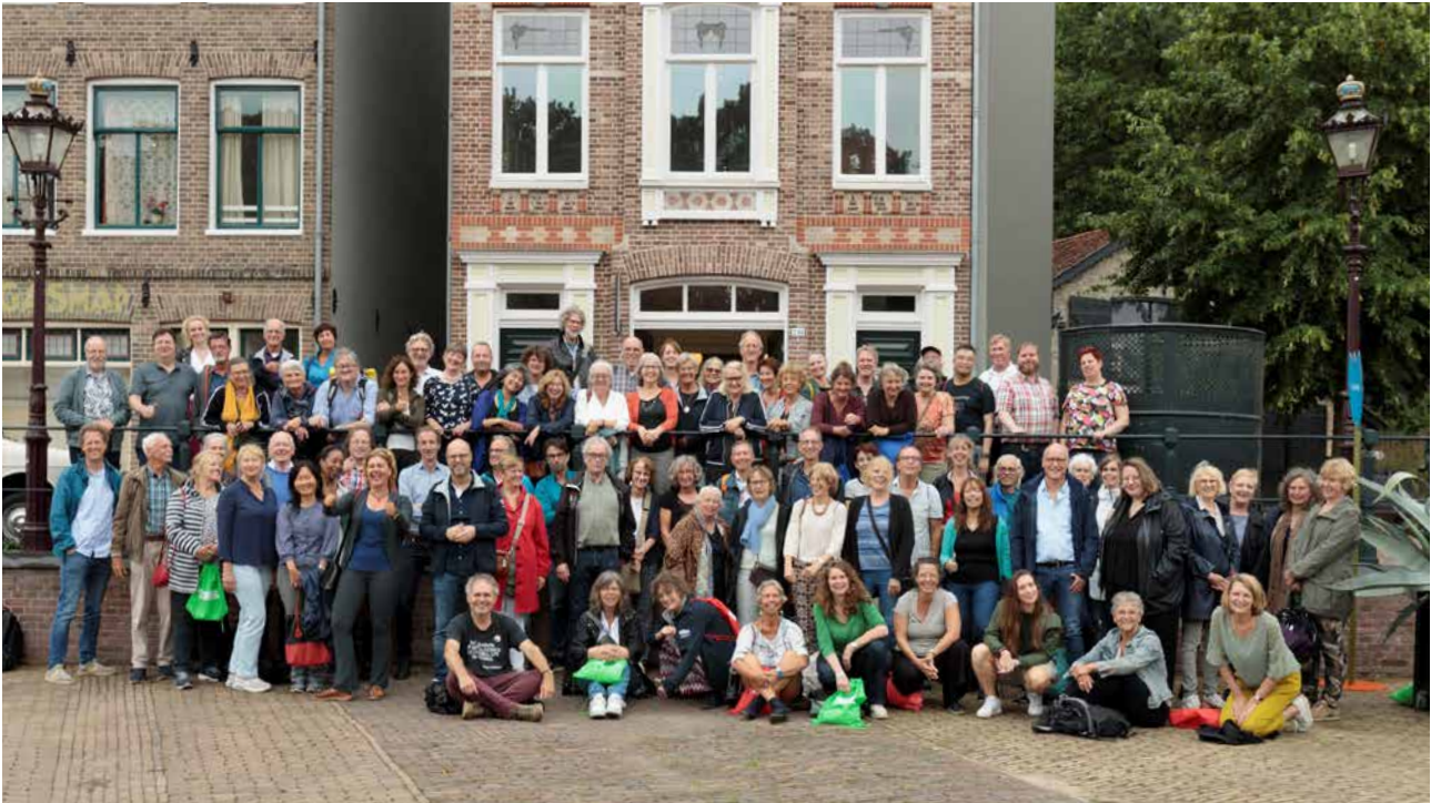
Vrijwilligersuitje 2023: Openluchtmuseum

Filmtheater Hilversum kan niet bestaan zonder de trouwe en betrokken vrijwilligers die zich ieder op hun eigen manier inzetten voor het filmtheater. Als onderdeel van ons beloningsbeleid organiseren we voor deze betrokken groep, die voor het grootste deel bestaat uit gepassioneerde filmliefhebbers, maandelijks (en bij speciale gelegenheden vaker) een voorpremière van een sterke nieuwe film die alleen toegankelijk is voor onze vrijwilligers en hun introducées. Een mooie bijkomstigheid hiervan is dat deze groep een belangrijke rol speelt in de zogenaamde 'word of mouth' van nieuwe films die in het filmtheater gaan draaien: zij maken voor ons persoonlijke reclame in hun eigen netwerk over films die je niet mag missen.