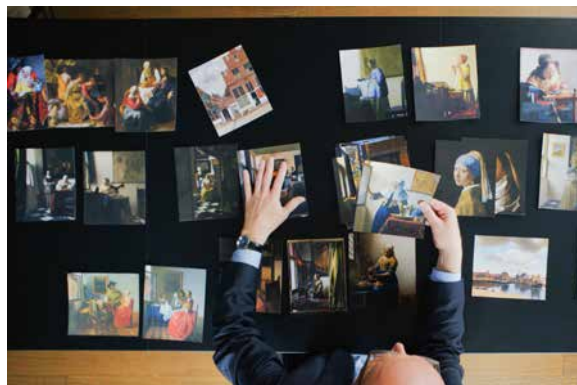
Beeld: Dichtbij Vermeer

Naast de vertoning van de premières van de belangrijkste documentaires die in ons land uitgebracht worden, bieden we extra veel aandacht voor dit genre in onze specials The Best of IDFA on Tour en Movies that Matter on Tour (vaak documentaires). Hierin bieden we veel bijzondere titels aan, waarvan sommige slechts enkele keren te zien zijn.