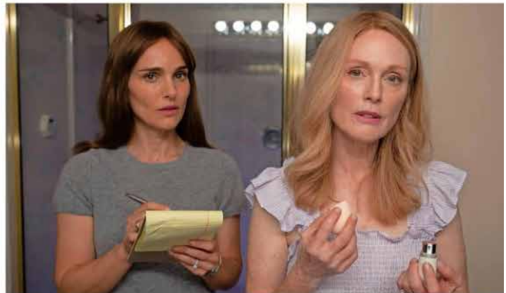
Natalie Portman en Julianne Moore spelen de hoofdrollen in de film May December.