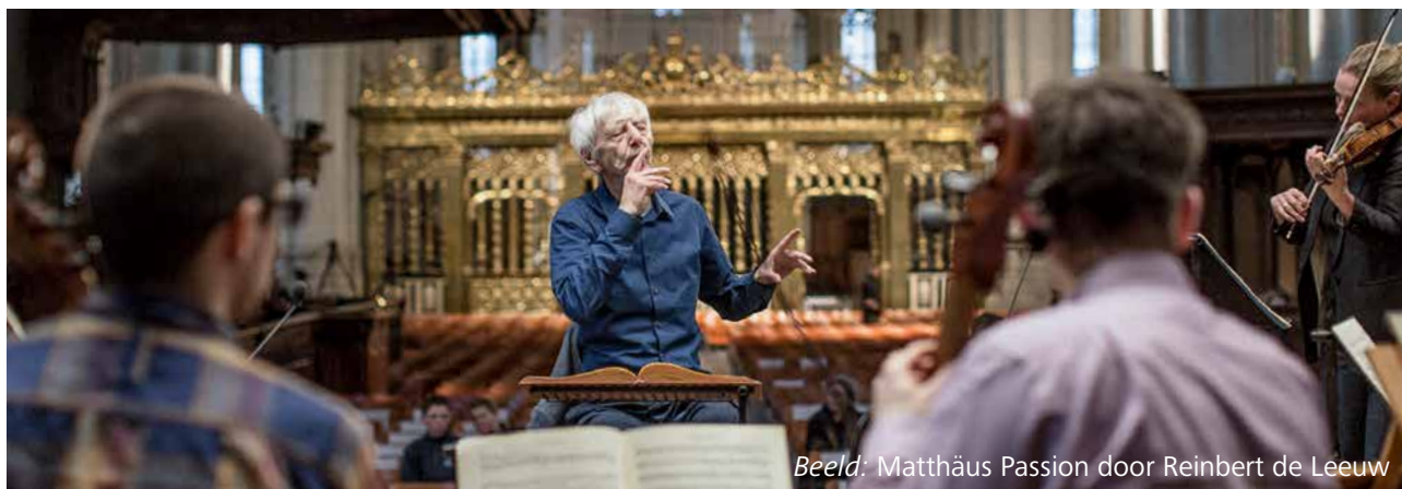
Beeld: Matthäus Passion door Reinbert de Leeuw

Reeds negen keer bracht Filmtheater Hilversum in samenwerking met lokale kerken tijdens de Veertigdagentijd een cyclus met films die passen bij de lijdensijd en Pasen, of anderszins over lijden en opoffering gaan. In 2023 kozen we ervoor om de thema's los te laten en rond de Paasperiode een gevarieerder programma van klassiekers en nieuwe films te vertonen. De films werden ingeleid, daarna was er voor bezoekers gelegenheid na te praten in onze foyer. In de Film & Religie-selectie vertoonden we enkele klassiekers ( The Last Temptation of Christ , Jesus Christ Superstar ) maar ook de complete uitvoering van de Matthäus Passion door Reinbert de Leeuw en nieuwe films ( De Man uit Rome ). Het Film & Religieprogramma werd in 2023 bijgewoond door 290 bezoekers.