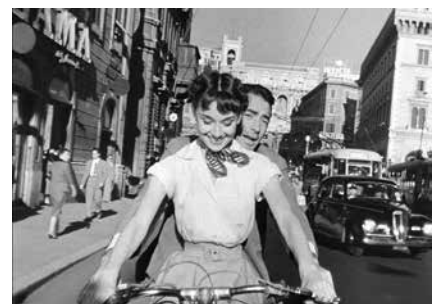
Beeld: Roman Holiday