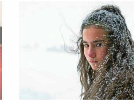
De Turkse film 'About dry grasses' is een beklemmend verhaal over een leraar die in een afgelegen dorp les gaat geven.