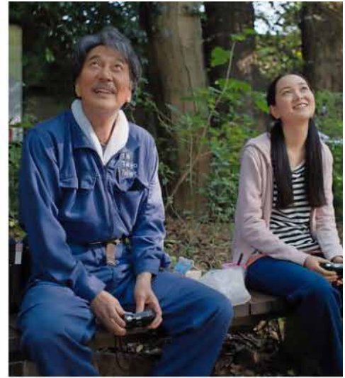
In 'Perfect Days' van Wim Wenders maak je kennis met een schoonmaker van openbare toiletten.